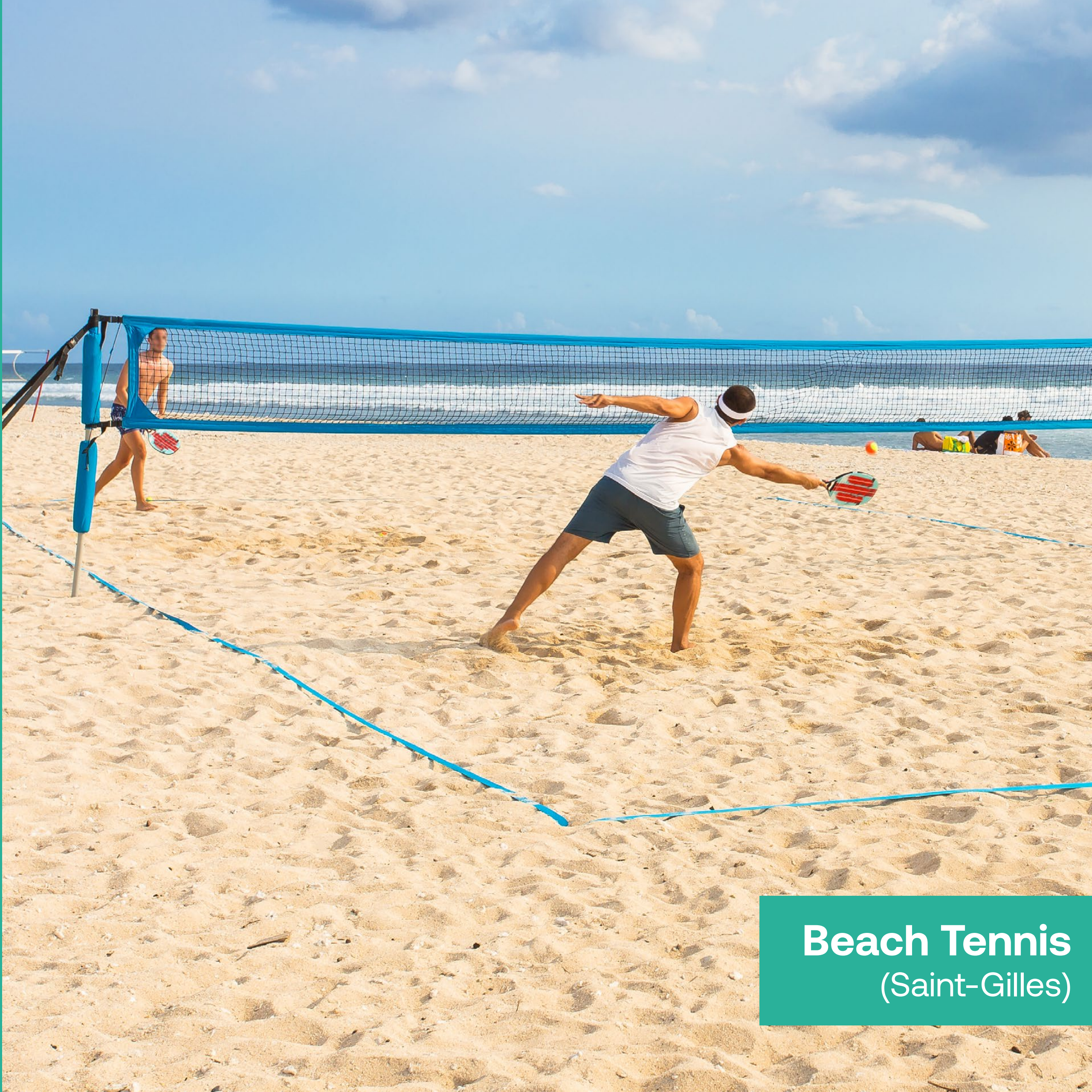
Beach Tennis (Saint-Gilles)