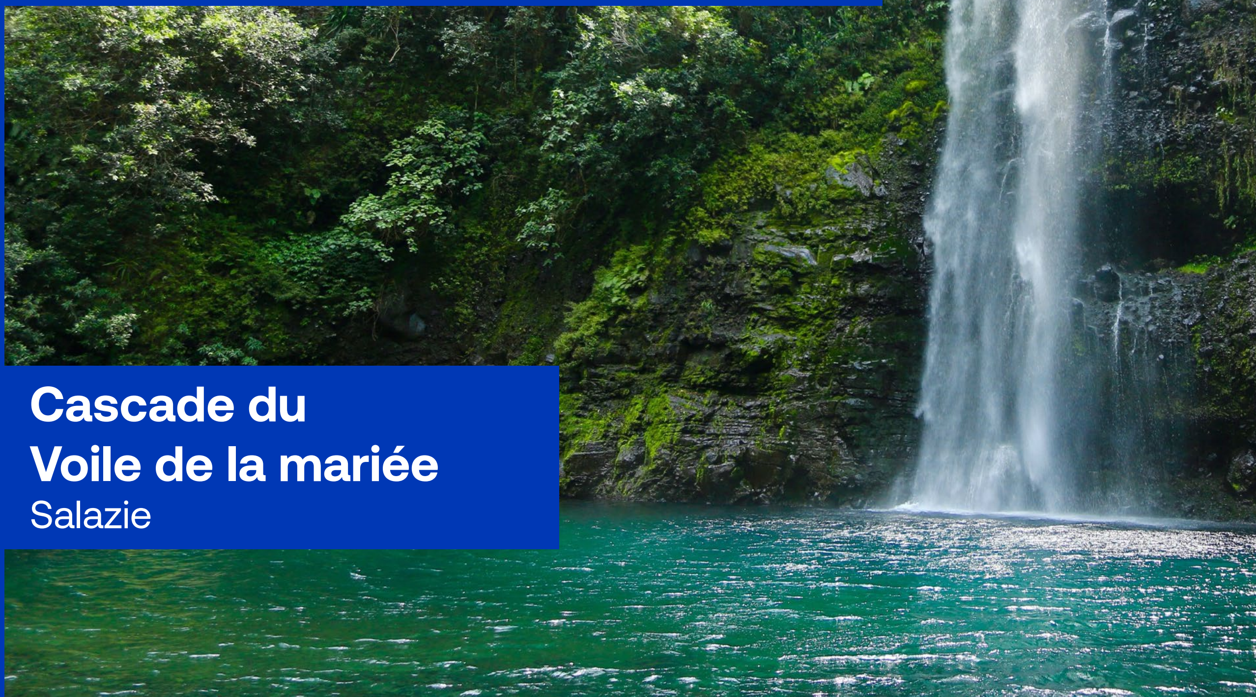
Cascade du Voile de la mariée Salazie

En raison de son caractère unique et sa position stratégique au cœur de l'océan Indien, La Réunion attire de nombreux équipementiers pour tester le matériel sur des surfaces variées, offrir la possibilité de faire des spots vidéo et publicitaires sur l'île, véritable terre de tournage et poursuivre l'accueil des équipes nationales dans différentes disciplines pour des entraînements sportifs inédits en pleine nature.