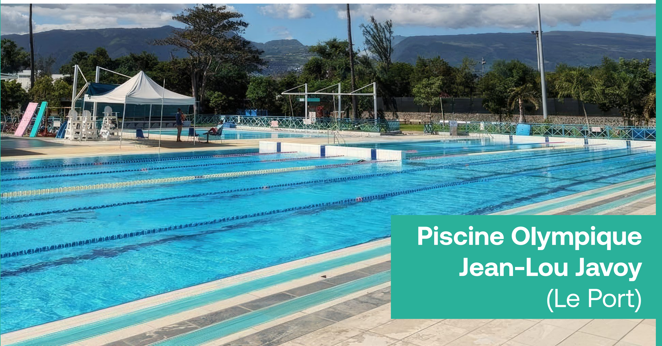
Piscine Olympique Jean-Lou Javoy (Le Port)

Territoire aux multiples atouts, la diversité géographique et culturelle de La Réunion en fait un terreau fertile pour le développement sportif et le rayonnement international. Le sport joue un rôle clé dans l'attractivité du territoire. Il génère des retombées économiques et améliore l'image de La Réunion sur la scène internationale. Les installations sportives de l'île attirent des équipes et des athlètes du monde entier.