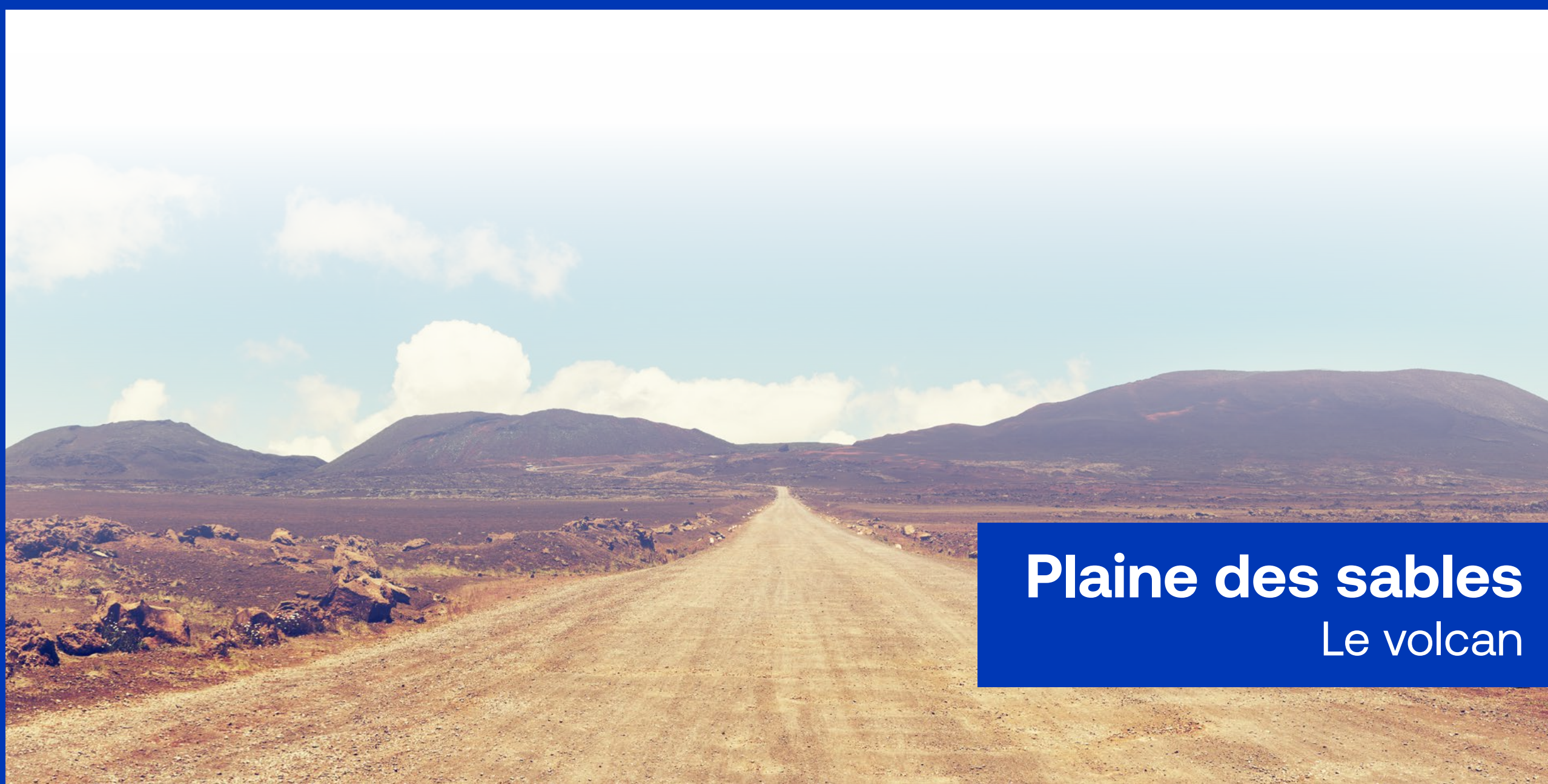
Plaine des sables Le volcan

En raison de son caractère unique et sa position stratégique au cœur de l'océan Indien, La Réunion attire de nombreux équipementiers pour tester le matériel sur des surfaces variées, offrir la possibilité de faire des spots vidéo et publicitaires sur l'île, véritable terre de tournage et poursuivre l'accueil des équipes nationales dans différentes disciplines pour des entraînements sportifs inédits en pleine nature.